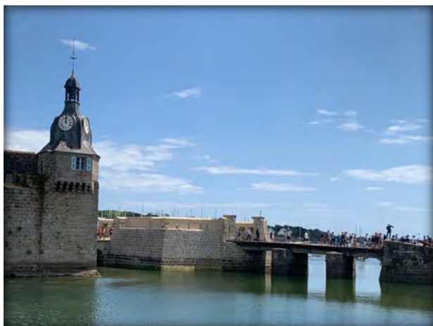
© Soc Patrimoine de la ville de Concarneau