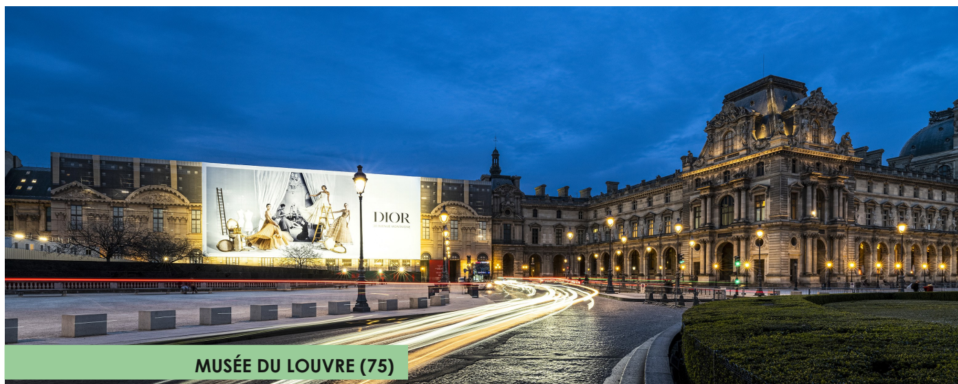
MUSÉE DU LOUVRE (75)

A THEM accompagne les collectivités, institutions culturelles, propriétaires d'édifices classés et annonceurs dans la réalisation de leurs projets scénographiques. À la manière d'un collectif, l'Atelier ATHEM réunit les ressources créatives, techniques et technologiques pour mettre en valeur un patrimoine qui peut être un lieu, une marque, un produit, un événement mais aussi une œuvre culturelle ou architecturale.